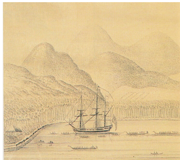
Le Dolphin de l'Anglais S. Wallis dans la baie de Matavai.

Devant le déploiement d'une telle force destructrice, les Polynésiens renoncèrent à leurs menées belliqueuses, non sans avoir subi de très lourdes pertes en vies humaines.