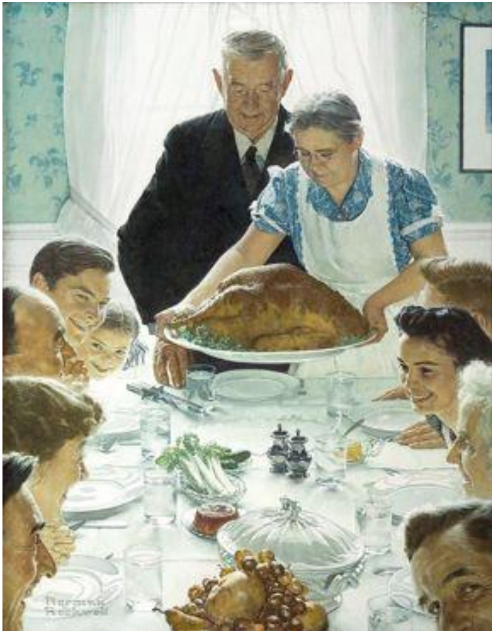
Document 3 : Norman Rockwell, À l'abri du besoin (Freedom from Want) , 1942, huile sur toile (116,2 x 90,2 cm), Stockbridge (MA), The Norman Rockwell Museum.