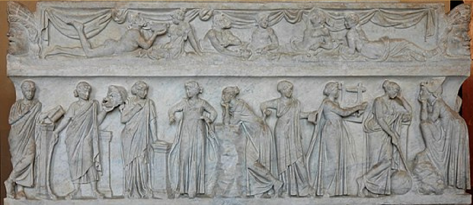
Sarcophage des Muses, 2ème siècle, Musée du Louvre